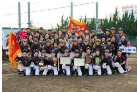
第2支部リーグ(A) 優勝 海神スパローズ