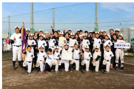
第1支部 FCC大会優勝 二和タイガース

第2支部では、支部リーグの決勝戦が行われ、AリーグはFTJとの接戦を1対0で制した海神スパローズが優勝、Bリーグは宮本ビーバースに勝利した西船ウイングスが、Cリーグは、FTJが若松ヤングズを8対2で退けて優勝の栄誉を勝ち取りました。