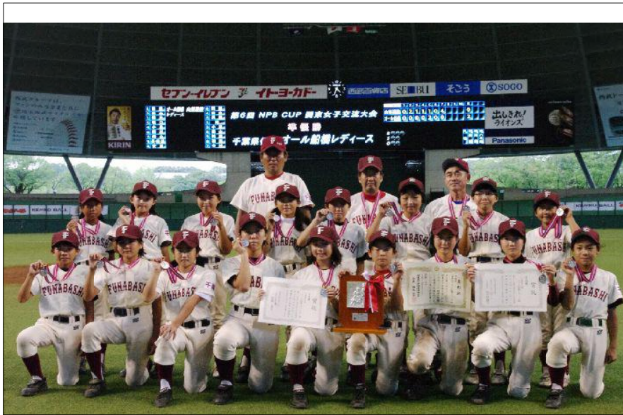
準優勝したオール船橋レディース

栃木県、群馬県、神奈川県、千葉県、埼玉県、東京都の一都七県の選抜チームが参加し行われた。千葉県代表オール船橋レディスは初戦、神奈川県選抜横浜DのNAベイスターズガールズに十対六で勝ち、二回戦も埼玉県